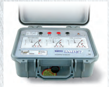
IMP57 Zubehör für Schleifenimpedanzmessung mit hoher Auflösung, max. 200A Prüfstrom