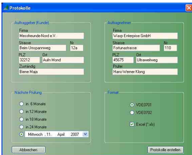
Eingabemaske für die Protokollerstellung