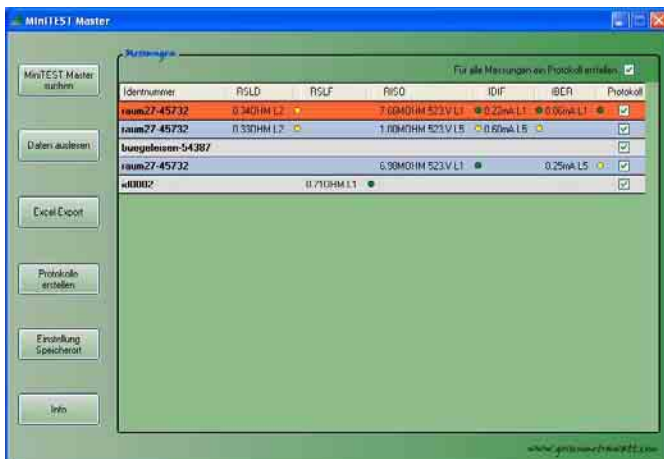
Auflistung der Messwerte nach dem Auslesen des Gerätespeichers