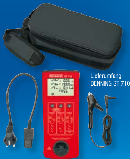
Lieferumfang BENNING ST 710

zur Messung von Differenz-, Schutzleiter- und Laststrom: 16 A CEE-Kupplung - CEE-Stecker (044127) 85,70 € 32 A CEE-Kupplung - CEE-Stecker (044128) 98,50 €