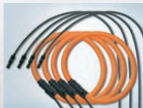
Jedes Modell hat 4 flexible Zangen für die Messung auch des Mittelleiterstroms