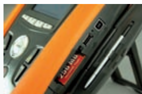
Einsetzen von Compact Flash für Speichererweiterung Pen Drive USB können für die Übertragung der Aufzeichnungen verwendet werden